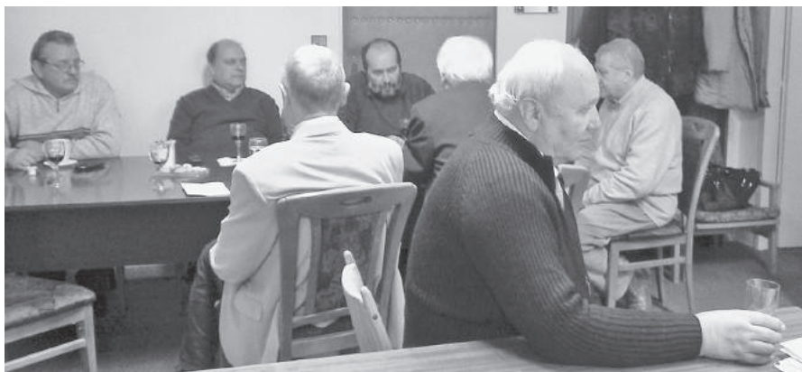
Čo nás čaká v tomto roku? Ťažká otázka.