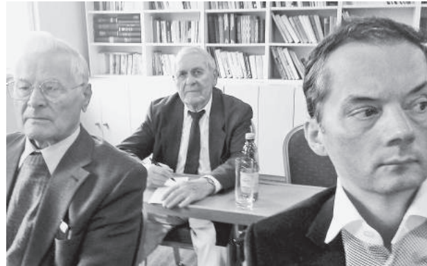
Vlani na seminári v Kaskádach.

Samozrejme, tam si každý na vás šľapne. Ako na muchu. A oznámi vám, že už ste tu. Väzni sú pre nich veľká banda. Na druhý deň nás previezli do bývalého židovského lágra, smerom na