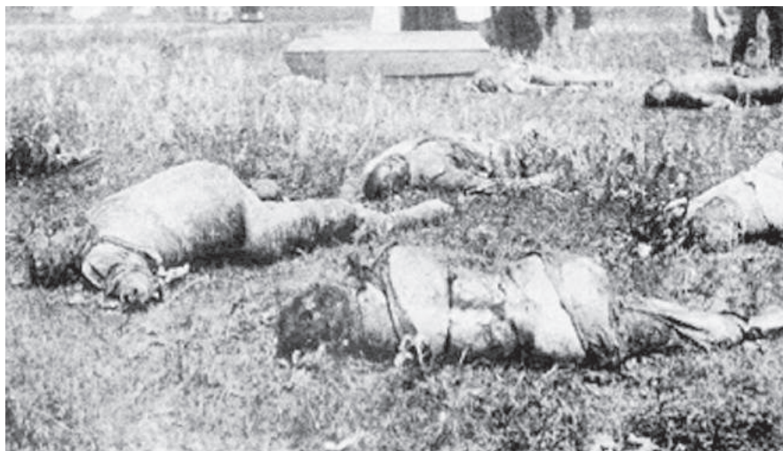
Charkov: obeť Čeky, podľa lekárov so znakmi mučenia, ktorým boli ruky odsekávané zaživa.