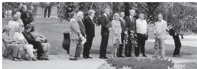
Kladenie kvetov pri Kaplnke sv. Michala v Košiciach.

Vedenie mesta Košíc zaviedlo termín pietnej spomienky vždy na nasledujúcu prvú nedeľu po dátume 7. september a rozšírilo ju na všetkých Košičanov, ktorí tragicky zahynuli pri rôznych udalostiach. Tento deň dostal názov Košický deň kvetov. Obyvatelia mesta v ten deň kladú kvety pri Kaplnke sv. Michala a spomínajú na všetkých, ktorí predčasne odišli z tohto sveta. Na pietnu spomienku pozval primátor mesta