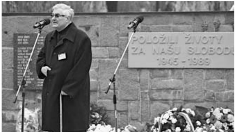
Vlani na Ružinovskom cintoríne...