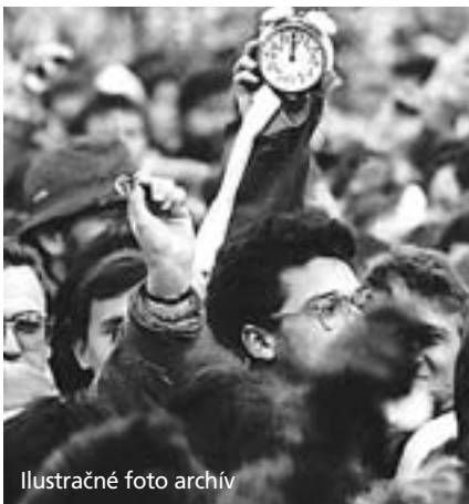
Ilustračné foto archív

pána Šefčíka v plnom rozsahu, za ktoré však zaplatil vlastným životom.- Takýchto vykonštruovaných prípadov bolo v tejto dobe na stovky, preto robme všetko pre to, aby sme zabránili návratu akejkolvek totality.