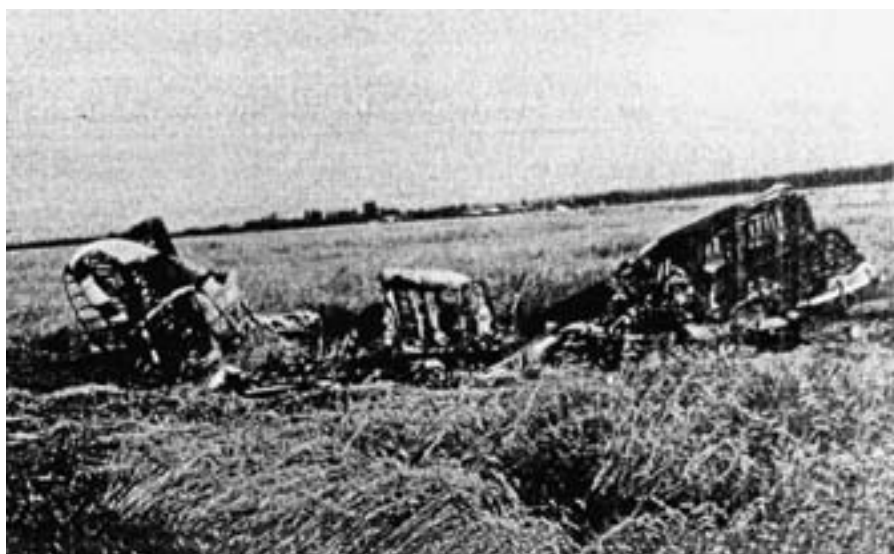
Vrak zostreleného lietadla.

Na jednej z nákladných koľají stál posunovací rušeň a asi 20 cm za sedadlom rušňovodiča bola diera po strele z lietadla, do ktorej som rovnako ako ostatní železničari pchal prst. Tá strela musela mať riadnu razanciu,