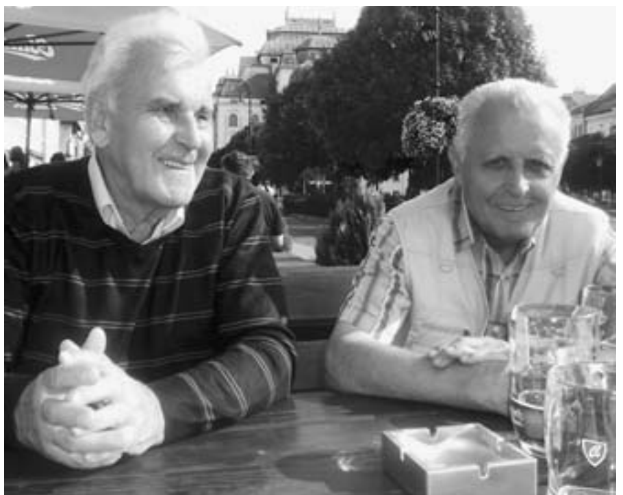
Siesta 21. augusta 2013.

Vy ste sa rozhodli emigrovať? A zhovárali ste sa s niekým o tomto vašom pláne?