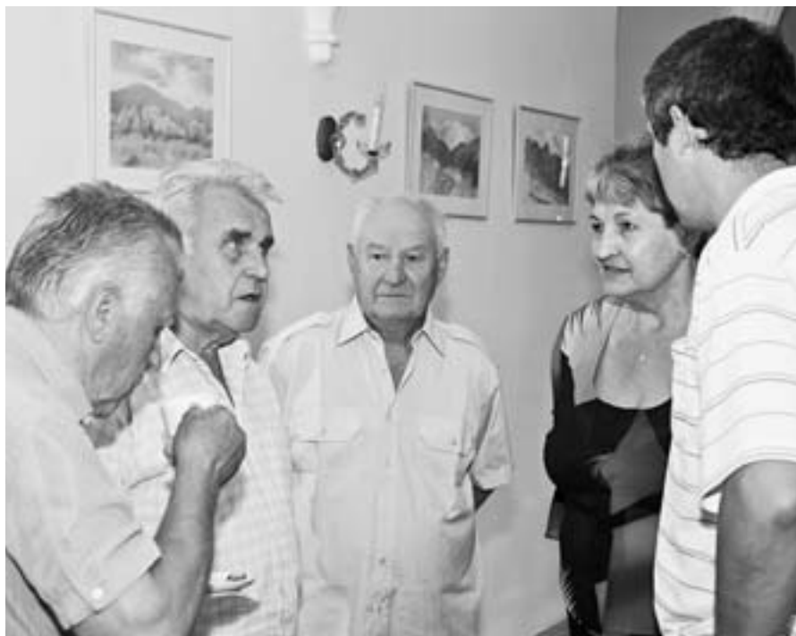
Počas prestávky (druhý sprava) na ostatnej konferencii v Smoleniciach.

Dvojročné. Keď prišli, nebol som v škole, lebo som maródoval. Prišli na ubikácie v sprievode veliteľa učebnej roty. Povedali mi, no, zoberte si svoje veci a ideme. Ste zatknutý. Ja im na to, počkajte, donesiem si vychádzkové šaty. Ale oni len odvrkli, nič vám netreba. Stačí tak, ako ste. Zobrali ma, nasadli sme do auta a v noci sme sa ocitli v Košiciach.