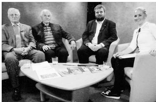
Pohľad do štúdia v Pezínku.