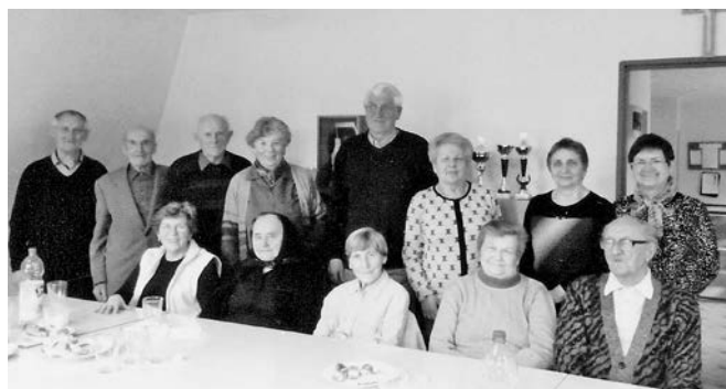
Schôdza v Dolnom Kubíne.