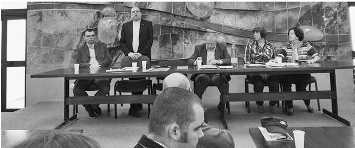
Na schôdzi v Trnave.