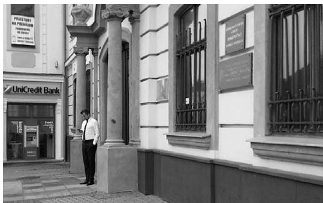
Z Biskupského úradu prejavil záujem o pietny akt len vrátnik...