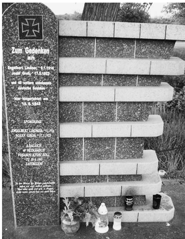
Pamätník nemeckých zajatcov zastrelených vojakmi Červenej armády v Devínskej Novej Vsi. Foto autor

a vykonaný mal byť do dvoch hodín od vynesenia rozsudku. Na vyslovenú žiadosť odsúdeného mohli pridať ešte hodinu, nič viac. Odvolanie nemalo odkladný účinok. Lanškrounski Nemci museli tiež prísť pred verejný tribunál kolenačky a pritom lízať Hitlerov obraz pošpinený gardistami a partizánmi, ktorí sa po odchode nemeckej armády všade rojili. Súd vynášal len dva druhy trestov – bitka od 10 do 100 rán železnou tyčou alebo šibenica. Kvôli