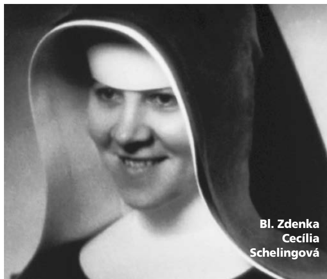
Bl. Zdenka Cecília Schelingová

blahorečenie a svätcov z nášho prostredia tak, ako sa to odohráva práve v tomto roku s donom Titusom Zemanom.