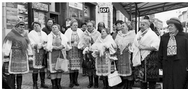
Ženská spevácka skupina z Helpy.