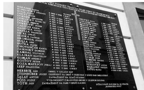
Pamätná tabuľa na Barbarskú noc. Je umiestnená na Biskupskom úrade v Banskej Bystrici.

A teraz aspoň pár domácich čísel. Hneď po roku 1945 Benešove „mimoriadne ľudové súdy“ odsúdili vo vtedajšom Česko-Slovensku asi 23 000 osôb, z toho 738 na trest smrti. Štatistiky pre roky 1948 – 1989 hovoria, že na Slovensku bolo evidovaných vyše 71 tisíc politických väzňov. V celom Česko-Slovensku bolo popravených 241 osôb. Pri výsluchoch ŠtB bolo zavraždených 600 osôb. Odvlečených orgánmi NKVD na Sibír od roku 1944