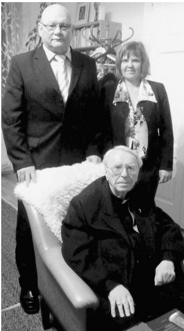
Na návšteve u kardinála Korca s manželkou.

prachu Kristov kríž, a potom bude úlohou Slovanov ten kríž niesť ďalej. Na Božiu slávu, na vlastnú záchranu i ako maják pre svet. Tie časy sú tu. A tu je aj odpoveď, prečo priam nesmieme byť vlastenci a nesmieme mať veľikánov a byť na nich hrdí.