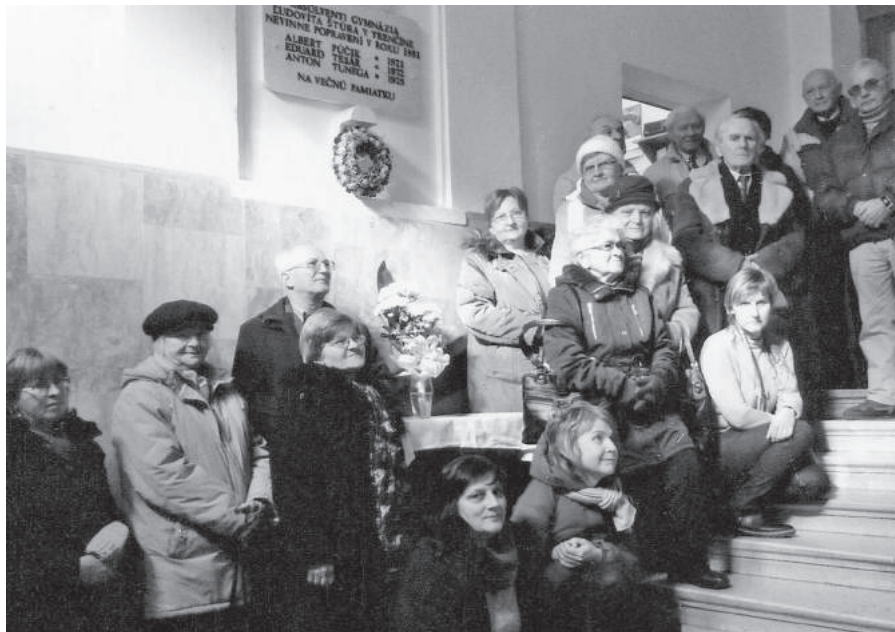
Účastníci pietnej spomienky na schodoch treňčianskeho gymnázia pri pamätnej tabuli martýrov.