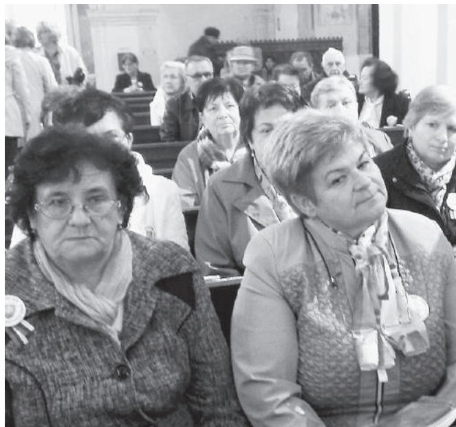
Speváčky z Hel'py počas sv. omše.

Po maďarskej revolúcii v roku 1956 sa začala nová vlna represálií, lebo vedenie komunistickej strany usúdilo, že tzv. kontrarevolučné sily ešte nie sú úplne porazené. Pripravili nové ťaženie, ktoré malo kriminalizáciou tzv. ľudáctva diskreditovať nielen Cirkev, ale najmä slovenské štátoprávne snahy. A tak eštebáci prišli opäť dp. Sliachana zatknúť. Asi dve desiatky príslušníkov ŠtB 7. marca 1958 Sliachanovi vyrabovali faru a jeho odvliekli. Jeho súdny proces sa konal od 22. do 26. apríla 1958 v Banskej Bystrici. Pripomínal arénu z rímskych čias, keď kresťanov hádzali pred zúrivé hladné levy. Aby sa zvýšila údernosť, proces vysielala televízia i rozhlas a písala o ňom vtedajšia tlač. Aj film o ňom premietali