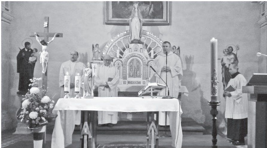
V Kostole sv. Alžbety.