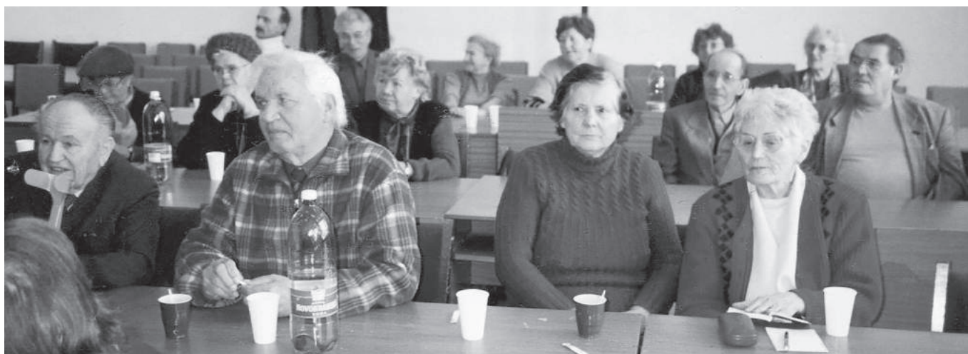
Pohľad na účastníkov výročnej členskej schôdze v Pezinku.