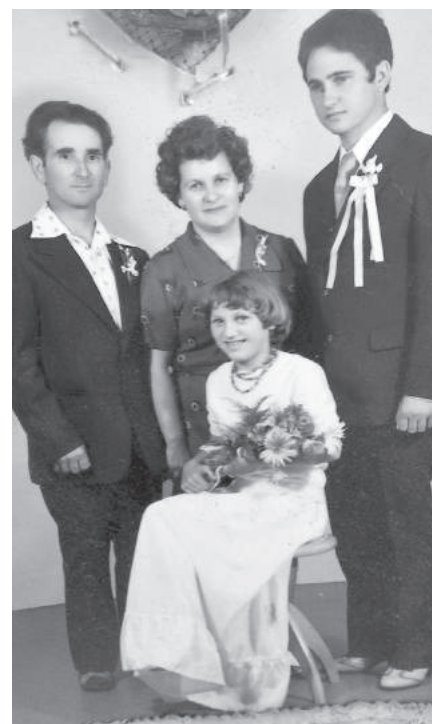
Manželia Poljačíkovci.

Traktor chcel sestrin manžel a ten naviedol brata, predsedu KSS