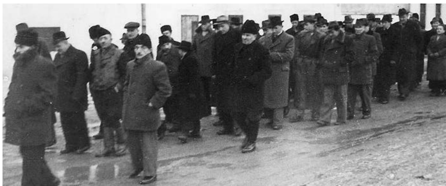
Snímka z pohrebu slovenského letca. V Šišove? V Dubodielí?

Otec sa vrátil z väzenia na Vianoce v roku 1952. Aj keď ho prepustili, stále ho posudzovali ako nespoľahlivého nepriateľa socializmu. Nemohol si nájsť prácu, iba ako brigádnik. Matka tiež mala problém zamestnať sa. Na základnej škole v Bošanoch mali na mňa spolužiaci večne nejaké narážky, až ma rodičia presunuli do školy v Topoľčanoch. Asi v roku 1966 až 1967 bol otec na základe žiadosti plne rehabilitovaný. V roku 1968 prišiel politický odmäk a to som práve prechádzal zo základnej školy na stred-