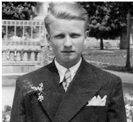
Neznámy letec Slovenskej armády pred kúpeľným domom v Trenčianskych Tepliciach.