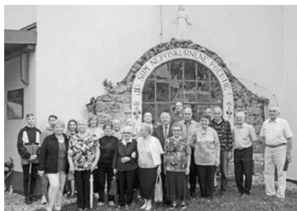
Účastníci pietnej spomienky v Zliechove.