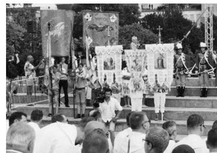
Svätoplukovo námestie v Nitre