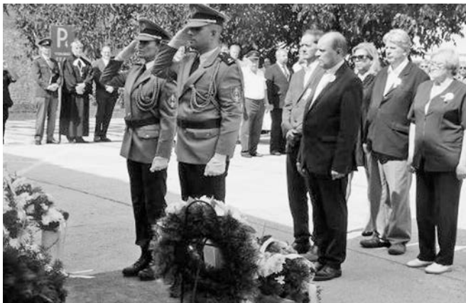
Kladenie vencov v Leopoldove.