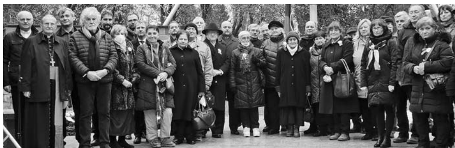
Spoločná fotografia pod krížom pamätníka.