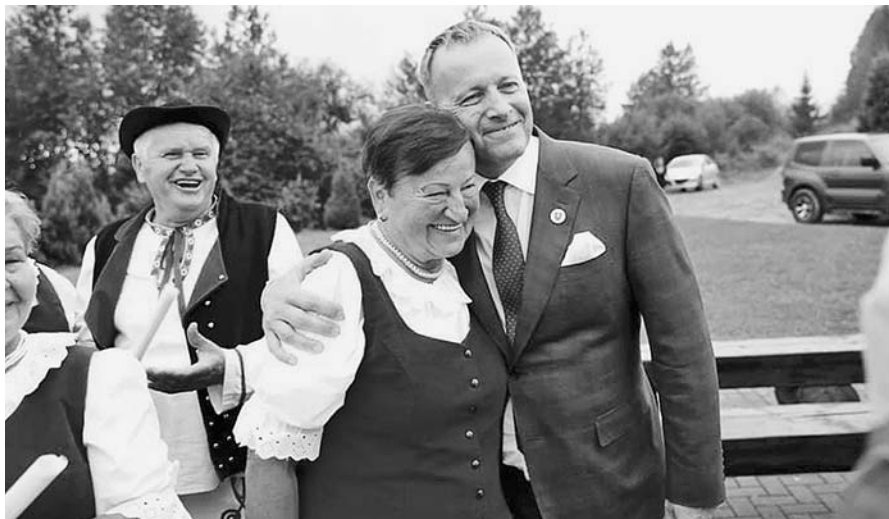
Boris Kollár s folkloristami.

Vianoce, ktoré som prežíval ako dieťa, boli skromnejšie, ale o to krajšie. Som