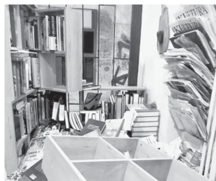
Zdemolovaná predajňa kníh.

Slovenská vzájomnosť alebo Svedectvo. Majiteľka je presvedčená, že práve to bol dôvod bezprecedentného ataku na kníhkupectvo – nie z lúpežných, ale ideologických dôvodov, čo je vo vyspelých krajinách považované za barbarstvo. (zel)