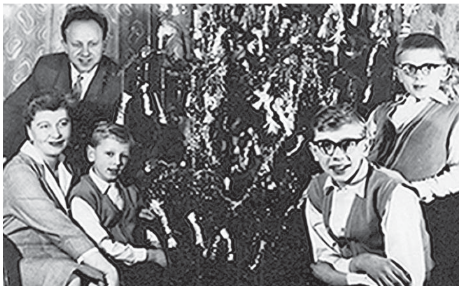
Rodina Žalobínovcov po návrate otca z väzenia.