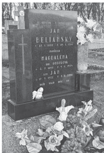
Hrob Belianskeho vo Veľkom Klíži.