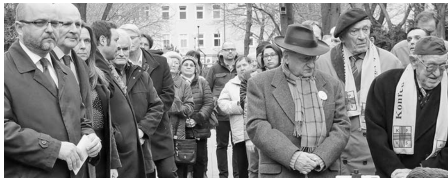
Účastníci pietnej spomienky na Jakubovom nám. v Bratislave.