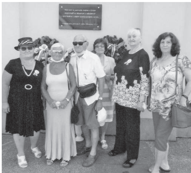
Pred väznicou v Nitre.