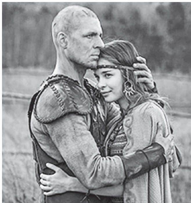
Snímka zo seriálu Slovania.