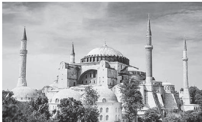
Hagia Sofia v Istanbule.

V islame jestvujú tri zdroje násilia, ktoré tvoria konjunkciu. Prvý zdroj násilia je odvodený z ich „svätej“ knihy Koránu. Násilie a brutalita je obsiahnutá v 180 veršoch a nenávisť k neveriacim v 349 veršoch Koránu.