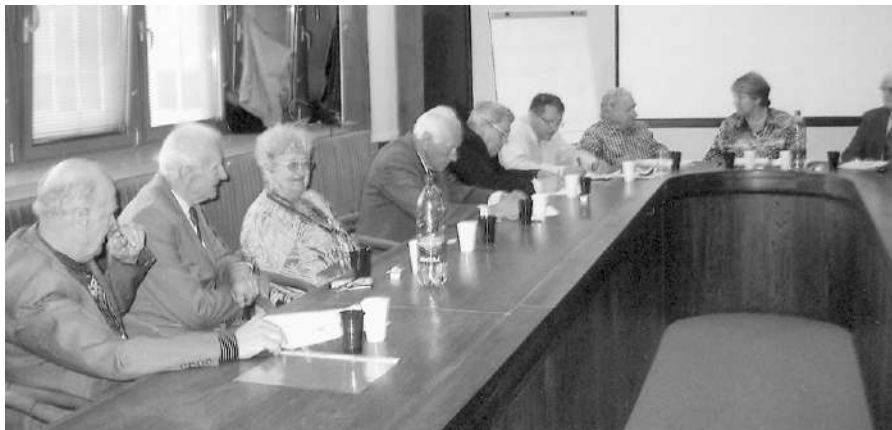
Pohľad na časť účastníkov rokovania Republikovej rady PV ZPKO v Bratislave.