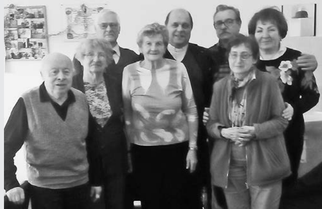
Trojkráľová schôdza v Pezinku.