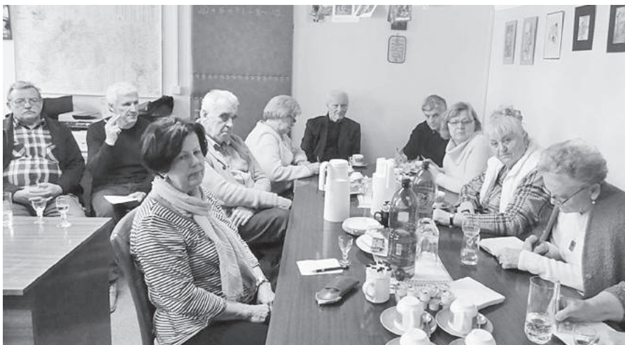
Účastníci Výkonnej rady PV ZPKO.