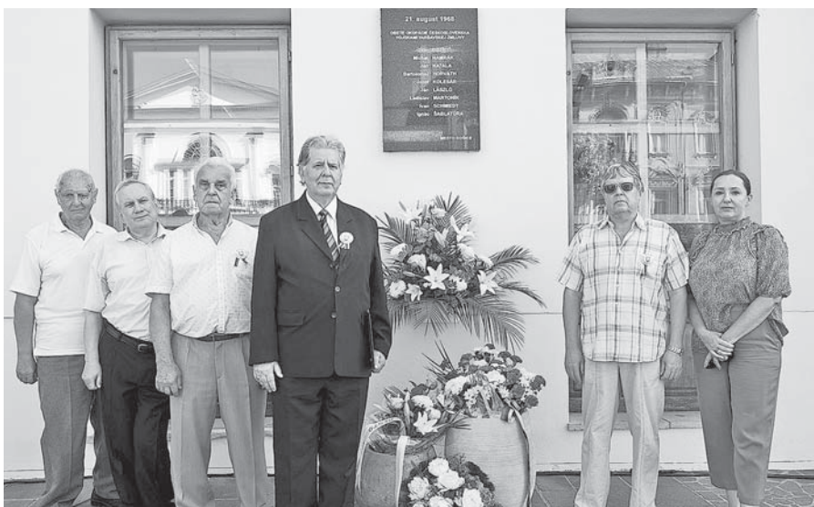
Členovia PV ZPKO pri pamätnej tabuli obetiam 21. augusta.

Nástupom Alexandra Dubčeka začiatkom januára 1968 bol naštartovaný demokratizačný proces, známy ako socializmus s ľudskou tvárou. Tento vývoj v Česko-Slovensku sa nepáčil sovietskemu vedeniu a po viacerých neúspešných rokovaniach sa rozhodli pre okupáciu. Asi hodinu pred polnocou 20. augusta 1968 okupačné vojská