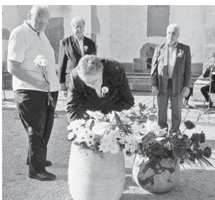
Uctievanie pamiatky obetí na Deň kvetov.