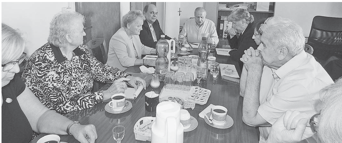
Predsedovia regionálnych organizácií za jedným rokovacím stolom.