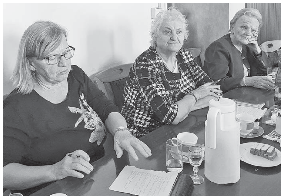
Vo vedení regionálnych organizácií PV ZPKO majú väčšinu ženy.