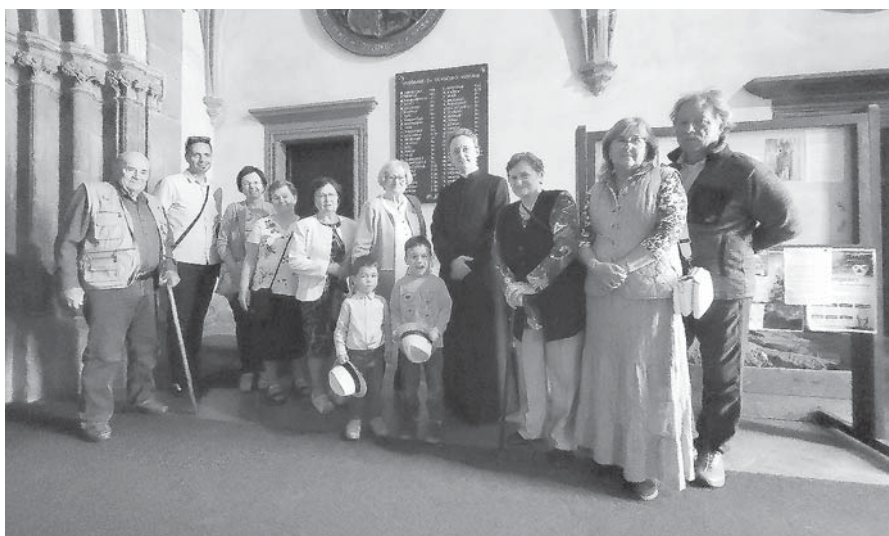
Tri generácie sa zišli pri pamätnej tabuli na Levočskú vzburu.

Už pápež Benedikt XVI. sa vo svojich komentároch k evanjeliám pýtal: „ Čo to vlastne znamená tá tesná brána? Prečo je mnoho tých, ktorí cez ňu nemôžu prejsť? Azda je táto brána určená len pre niekoľkých vyvolených? “ takto sa pýtal pápež Benedikt. A hneď aj na tieto otázky odpovedal: „ Nie je to tak! Kristovo evanjelium nám hovorí, že všetci môžeme vstúpiť do života. Tá brána je síce tesná, ale je otvorená pre