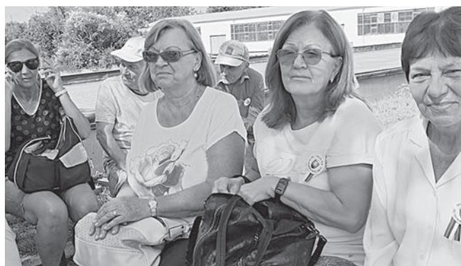
Banskobystrická časť delegácie tohto roku v Leopoldove.

Na „svojich“ politických väzňov spomínali pod múrom leopoldovskej väznice naše členky aj z regionálnej organizácie v Banskej Bystrici. Je zarážajúce, že dnes sa za politických väzňov komunistického režimu považujú bývalí komunisti, napríklad Milan Šimečka a Miroslav Kusý, ktorí sa podieľali na etablovaní sa tohto totalitného režimu na Slovensku. Sú s nimi natačané filmy, propaguje ich televízia. Uvedomujú si ich tvorcovia, aké poslanstvo predstavujú? Ako sa mohli cítiť pozostalí po obetiach komunizmu napríklad 24. septembra t.r. pri sledovaní druhého programu STVR ŠtB: Prísne tajné? (zl)