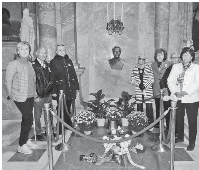
Členky nitrianskej organizácie PV ZPKO pri hrobe kardinála Korca.