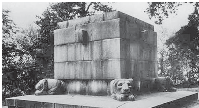
Podstavec pod pomník na Murmanskej výšine nad Bratislavou jestvuje už od roku 1925.