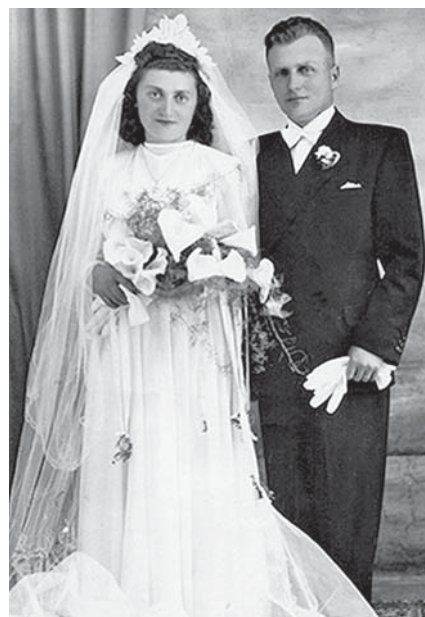
Svadobná fotografia rodičov pána Sýkoru.

● Hovorili ste o príkoriach rodiny, ale aj vy ste narazili na systém. Prečo? Nevstúpili ste do strany?