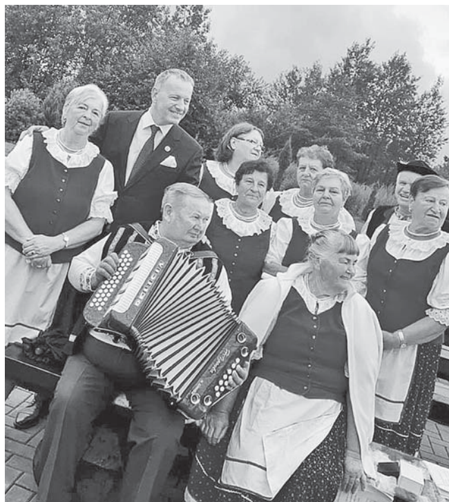
Predsa NR SR Boris Kollár so svojimi priaznivcami.

„Keď si uvedomíme, koľko času, energie aj peňazí je venovaných rôznym menšinovým a marginalizovaným skupinám a pritom sa nám priamo pod nosom dejú také strašné veci, ako je tyranizovanie, psychické ponižovanie, hrubé zanedbávanie starostlivosti našich rodičov a starých rodičov, ktorí mimochodom, patria k najpočetnejšej skupine obyva-