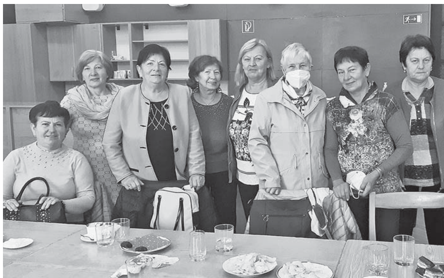
Prvú výročnú členskú schôdzu zorganizovali v Banskej Bystrici.