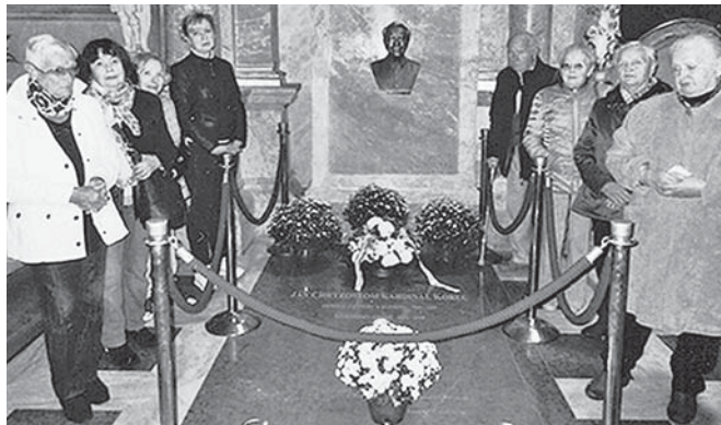
Pobočka PV ZPKO v Nitre spomína pri hrobke Jána Chryzostoma kardinála Korca na jeho nezabudnuteľné účinkovanie.

Druhá skúsenosť sa odohrala na Kalvárii v Nitre v roku 1988. V noci zo 14. na 15. augusta tam bolo plno eštabákov. Konala sa odpustová slávnosť Nanebovzatia Panny Márie. O 24. hodine bolo po prvýkrát na pódiu, kde prebiehal program oznámený, že Ján Chryzostom Korec je oficiálnym biskupom Rímskokatolíckej cirkvi. Nastal nadšený potlesk a prevolávanie na slávu. Biskup Korec potom do rána odpo-