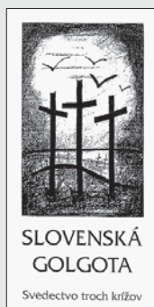
SLOVENSKÁ GOLGOTA Svedectvo troch krížov

Ich aktivity gradovali v roku 1948, keď už sa ľudovodemokratický režim v Československu transformoval na neobmedzenú vládu komunistickej strany.