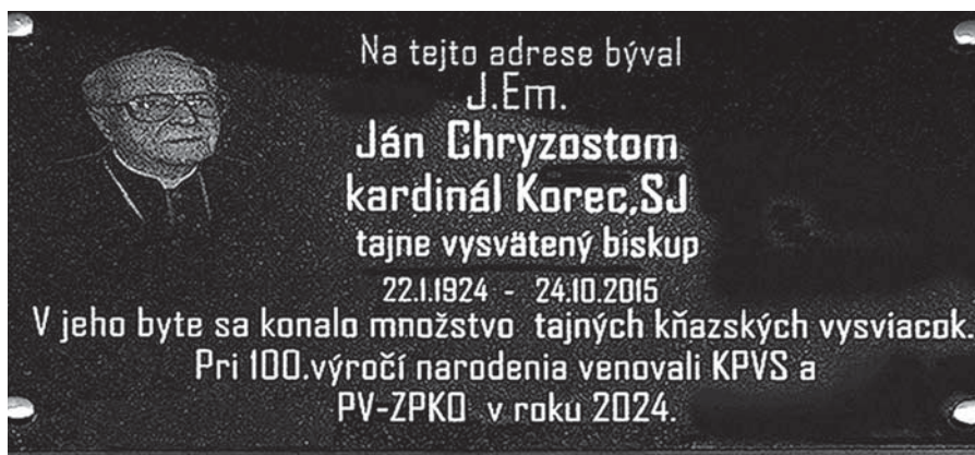
Pamätná tabuľa v Bratislave na Vilovej 7.