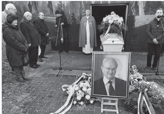
Rozlúčka na Vrakunskom cintoríne.

Nie dobrou vizitkou vedenia Cirkvi bolo aj to, že na rozlúčke s touto osobnosťou európskeho formátu neboli zástupcovia médií (Lumen, Lux, KN a pod.). Kamerový záznam bol zverejnený len vďaka katolíckemu aktivistovi Antonovi Čulenovi. Apropos, keď spomínam Katolícke noviny, ich najnovšie vydanie (č. 6/2024) venovalo profesorovi presne štyri vety – že zomrel a bol pochova-