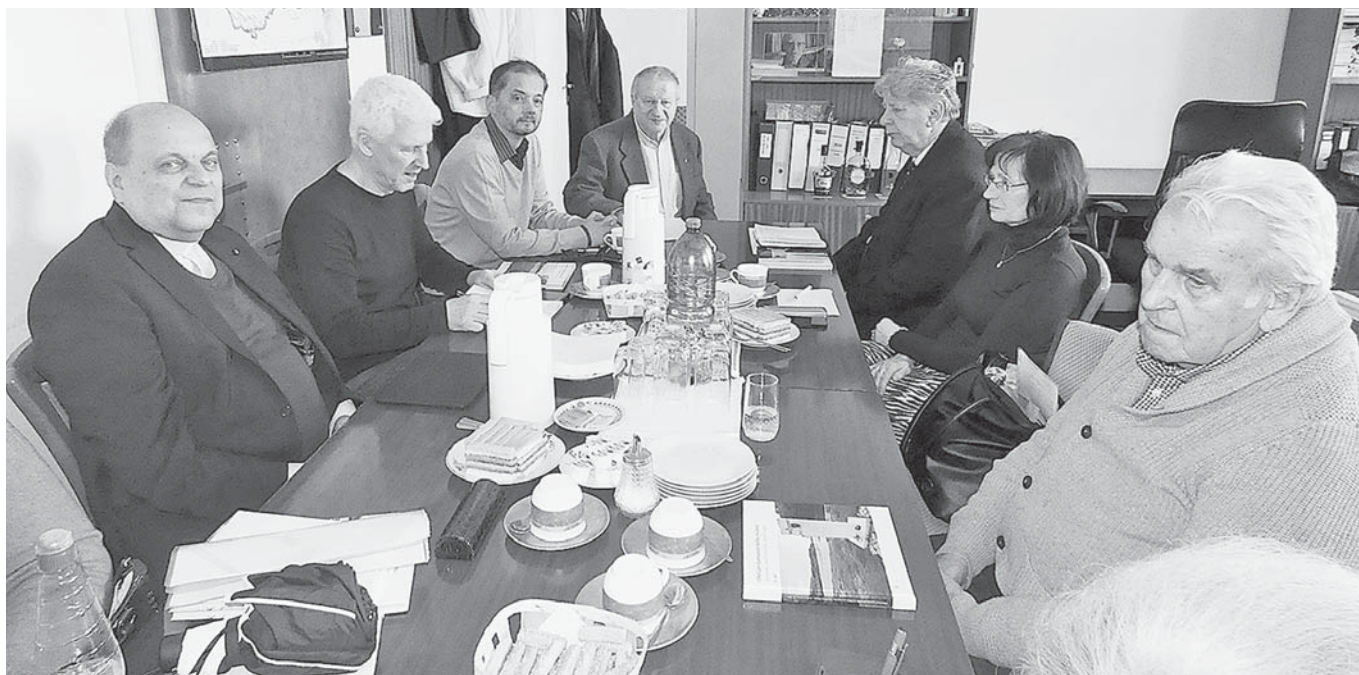
Členovia Výkonnej rady PV ZPKO počas rokovania.