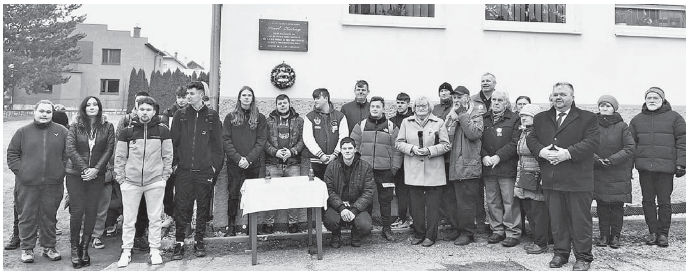
Účastníci pietnej spomienky v Bijacovciach.