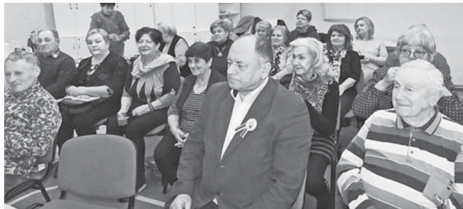
Výročná schôdza sa konala netradične v priestoroch farského úradu.