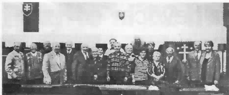
Po výročnej schôdzi v Žiline.