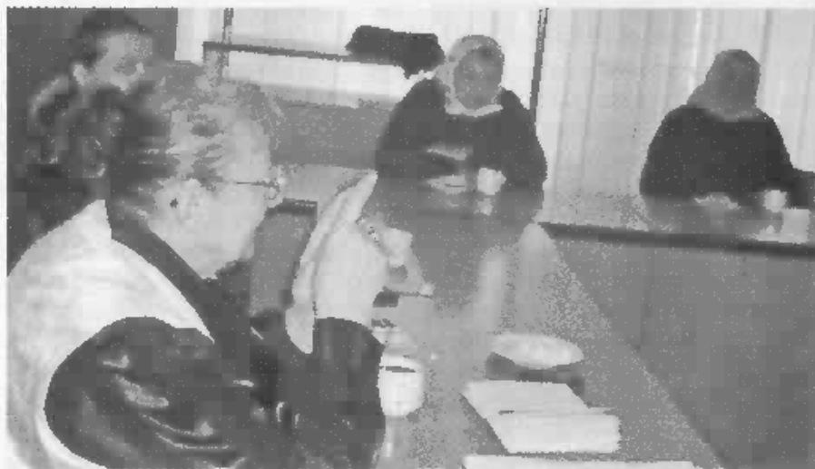
V Skalici spomínali a diskutovali.