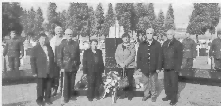
Politickí väzni regiónu Košice sa zúčastnili na tohtoročnej spomienke na Malú vojnu.

Maďarsko 13. marca 1939 odozdalo veľvyslancom Česko-Slovenska náotu, v ktorej žiadalo odstúpenie územia Podkarpatskej Rusi. Skôr, ako stihla česko-slovenská vláda reagovať, bol vyhlásený samostatný Slovenský štát. Obsadením Podkarpatskej Rusi sa však ani zčohleka nenaplnili agresívne plány maďarského velenia. Na rad prišlo východné Slovensko. Toto nebezpečenstvo si plne uvedomoval aj minister obrany novej slovenskej vlády pplk. Ferdinand Čatloš. Hneď v marci 1939 mobilizoval päť ročníkov I. zálohy, čo ale nevyriešilo kritickú situáciu na slovenskom východe.