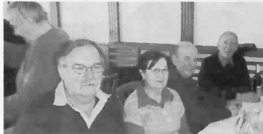
Na výročnej členskej schôdzi regionálnej pobočky PV ZPKO Spišská Nová Ves-Levoča si pripomenuli aj okrúhle životné jubileá svojich členiek.

Zmieniť sa aj o drastickom znížení dotácie na činnosť PV ZPKO zo strany Ministerstva vnútra SR na rok 2012, čo bude mať negatívny dopad na rozsah činností. Pozornosť venovali aj piatim jubilantom. (af)