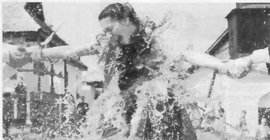
Veľkonočná oblievačka na východnom Slovensku.

Dôraz, ktorý Slováci kladú na jasne predkresťanskú veľkonočnú kú-