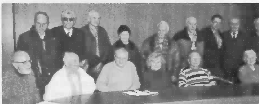
Na výročnej schôdzi v Bratislave.