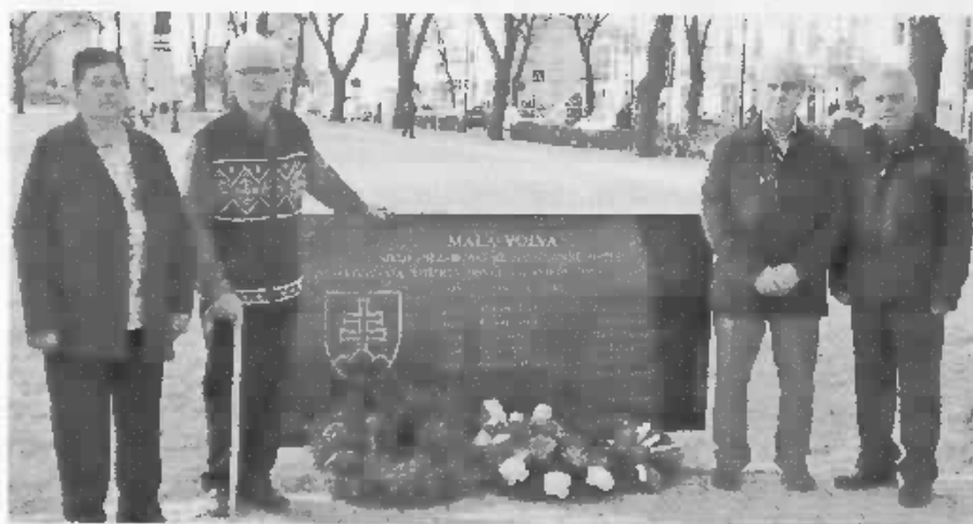
Na budúci rok sa piétna spomienka na Malú vojnu uskutoční pri novom pamätníku v centre Spišskej Novej Vsi.

slovenské jednotky prešli 24. marca 1939 pri Stakčine do neúspešného protiútokov. 24. marca 1939 sa slovenské letectvo zameralo na priamu podporu protiútokov pozemných síl. Vyvrcholením leteckých bojov bol večer 24. marca 1939 nálet na letisko v Spišskej Novej Vsi. Maďarské velenie mienilo vyradiť hlavnú základňu protivníka monutným útokom bombardérov Junkers Ju86K-2. Útok sa malo zúčastniť 18 lietadiel Škody po nálete bol veľký, tak na majetku, ako aj na ľudských životoch. Zahynulo 12 ľudí a 17 bolo zranených. Na letisku bolo poškodených sedem lietadiel. V nou zmätkov v organizácii maďarské letectvo omylom bombardovalo aj Rožňavu, ktorá bola už vtedy na maďarskom území. Nálet na Spišskú Novú Ves podúril slovenské obyvateľstvo. Plánovať sa odvetný nálet na Budapešť. Ukončenie bojov však tento zámer zneškodnilo. 25. marca 1939 boje ustali. Maďari okupovali pás pohraničného územia na východe Slovenska, avšak okupácie celého východného Slovenska sa museli vzdať. Pod tlakom Nemcka bol donútení podpísať prímerie. Slovensko-maďarský konflikt na východe Slovenska vošiel do histórie pod názvom Malá vojna.