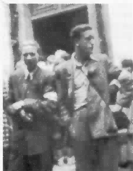
Ako sprievodca pútnikov z Banskej Bystrice na Starých Horách.