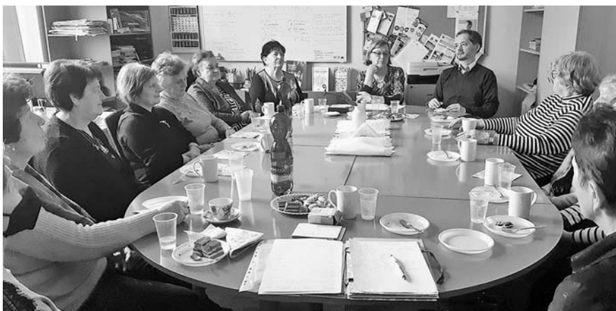
Väčšinu na schôdzi v Banskej Bystrici tvorili ženy.