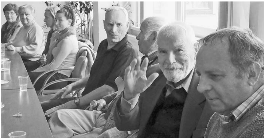
Časť účastníkov schôdze v Nitre.