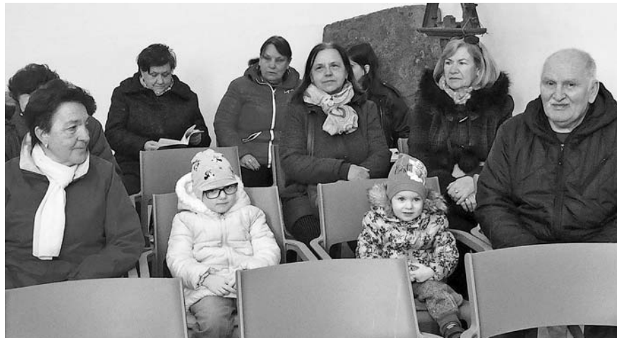
Na sv. omši v zámockej kaplnke sa zúčastnili všetky vekové kategórie...