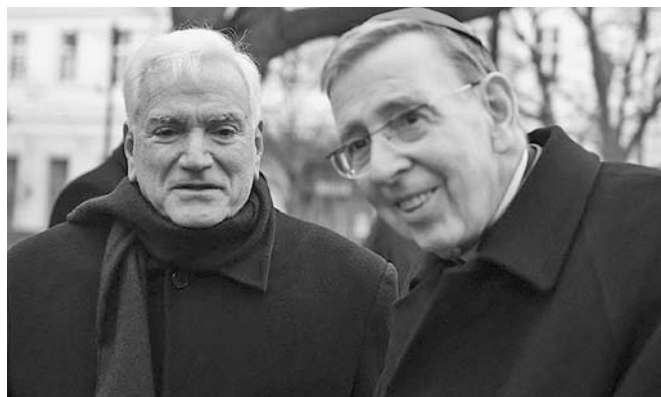
Na 35. výročie „Sviečkovej manifestácie“ prišiel do Bratislavy v sprievode apoštolského nuncia Nicolu Girasoliho (vľavo) aj kardinál Kurt Koch z Vatikánu.