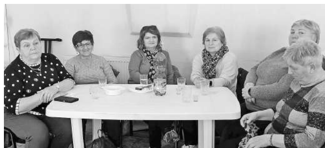
Väčšinu členstva v Banskej Bystrici tvoria ženy.