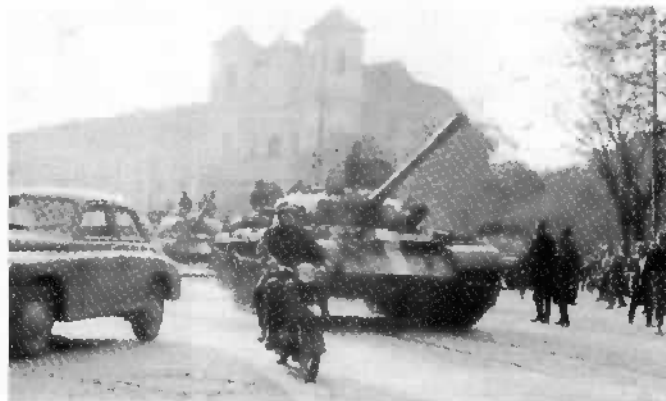
Internacionálna „pomoc“ Česko-Slovensku v roku 1968.

Za prezidenta republiky zvolili generála Ludvíka Svobodu. Prudký revolučný vietor začal viať hlbšie. ÚV KSČ