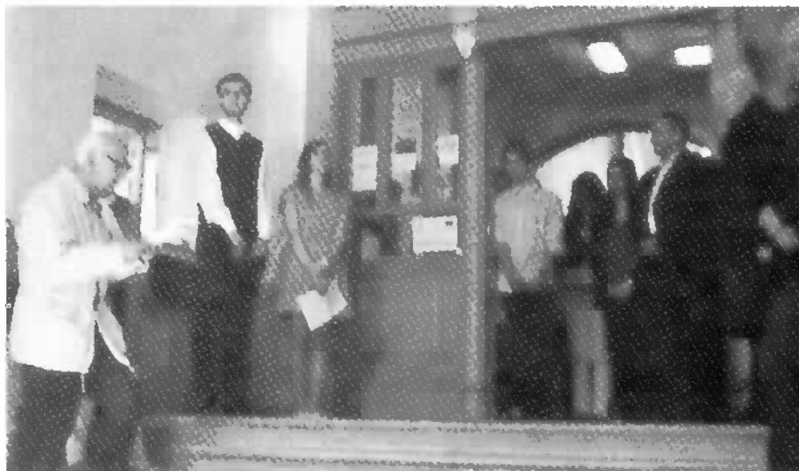
Pri pamätníku v trenčianskom gymnázii.

Boli kruto umučení a v noci 20. februára 1951 popravení (ich poprava sa vykonala nadránom od 4,20 hod. do 6,00 hod.). Pochovali