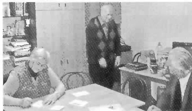
Atmosféra pred začiatkom schôdze v Ružomberku.