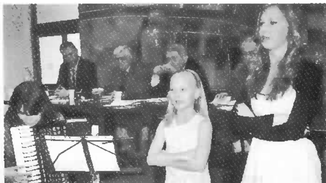
Kultúrny program na výročnú schôdzu v Trnave pripravili deti z hudobnej školy v Trnave.

správe za uplynulé obdobie pokračovala schôdza diskusiou, v ktorej členovia organizácie dávali najavo, že im nie je ľahostajné, čo sa deje na politickej scéne Slovenska. Poukazovali na netoleranciu a aroganciu tých, čo v krátkom čase nadobudli obrovské majetky i na vysoké percento nezamestnanosti. Nezamestnanosť odporúčajú riešiť systémovými zmenami z prostriedkov určených na podporu nezamestnaných. Poukázali tiež na nezodpovedné konanie voči tým, ktorí 40 rokov trpeli, zaslúžili sa o pád komunizmu, celé roky strávili vo väzniciach a v súčasnosti živia pre nedostatok prostriedkov na svoju existenciu.