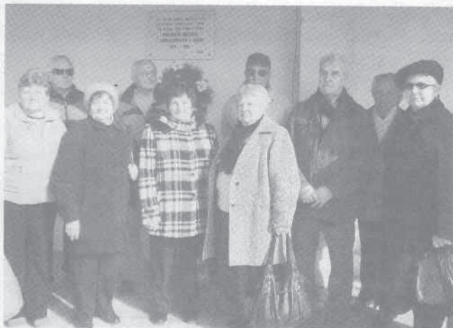
V Levoči spomínali na barbarskú noc.