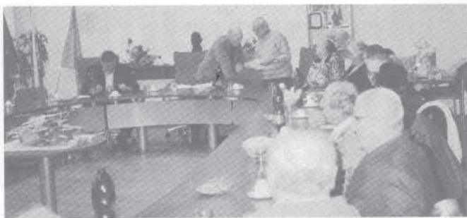
Na výročnej schôdzi v Nitre.