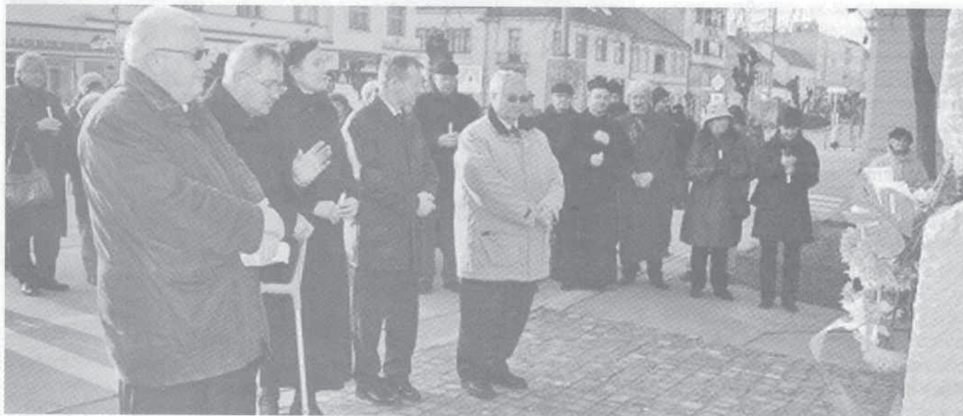
V Trnave si sviečkovú manifestáciu pripomenuli viaceré organizácie spoločne.