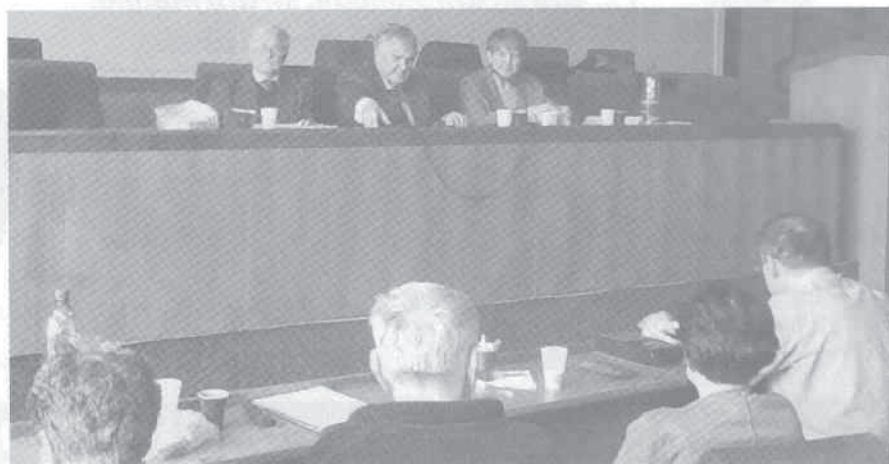
Kompletné predsedníctvo Republikovej rady PV ZPKO na rokovaní v Žiline.

MATERIÁLY uverejnené v rubrikách „Čitateľské fórum“ a „Spomienky“ vyjadrujú názory občanov a čitateľov. Nemusia byť totožné so stanoviskom redakcie.