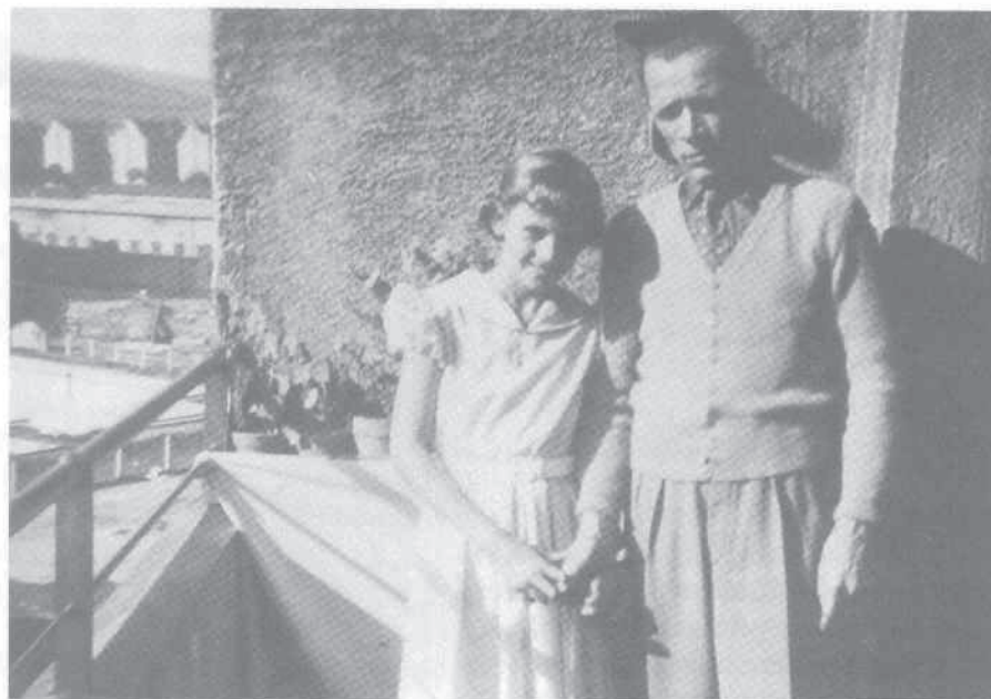
Chvíľu s otcom na balkóne.

Raz ho pustili na týždeň z Jáchymova na Vianoce domov na „dovolenku“. Keď počul na schodisku buchnúť dvere tak sa naľakal, že v momente skočil do kúpeľne. Akoby