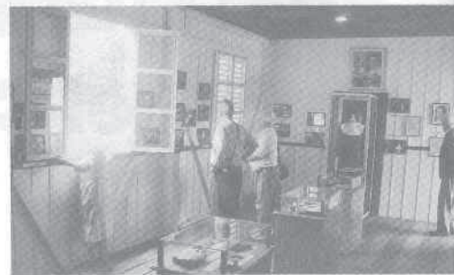
Múzeum v Sucua.

A čo povedať na záver. V slovenských bulvárnych médiách nám každodenne ponúkajú takzvané "celebrity". Tieto "celebrity" sú maximálne známe na úrovni teritória medzi Drietomou a Čiernou nad Tisou. Tie pravé, nezná-