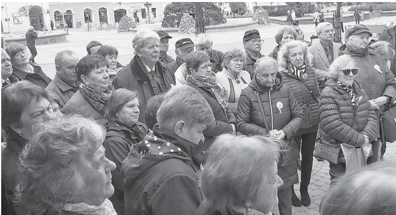
Účastníci pietnej spomienky pred pamätnou tabuľou obetí Barbarskej noci v Banskej Bystrici.