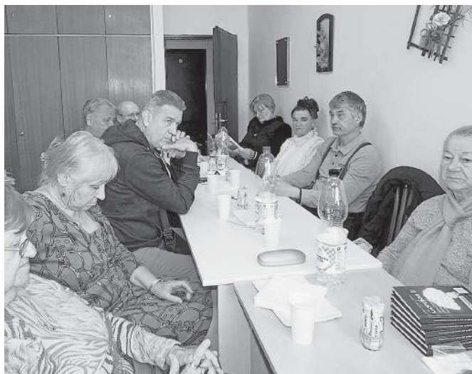
Časť účastníkov rokovania v Trnave.

Správu o hospodárení prečítala podpredsedníčka a hospodárka RO Jana Masařová. Poďakovala sa všetkým, ktorí