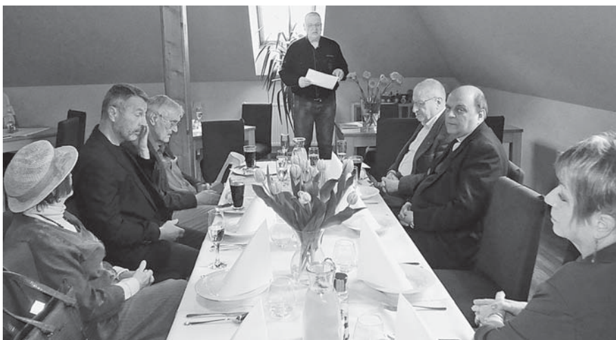
Na schôdzi v Prievidzi.

Z plánu činnosti na rok 2024 spomenul kladenie vencov na bojníckom