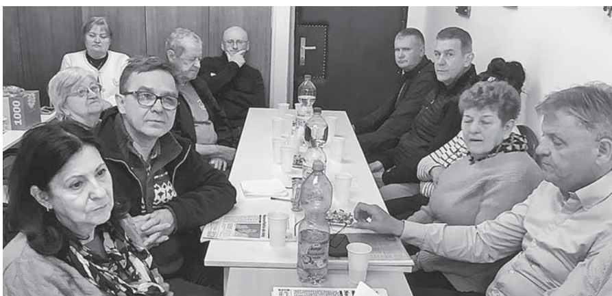
Na schôdzi v Trnave.

V diskusii bol najhlavnejším bodom Jáchymov, zhodnotenie minulo-