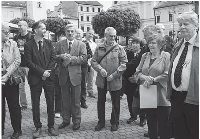
Prišli členovia zo všetkých kútov Slovenska.

Jeho protibolševický postoj pramenil z osobnej skúsenosti. Už na jar 1919, počas vpádu maďarských bolševikov, ho ako uvedomelého Slováka a kňaza chceli zabiť. Len o vlas unikol osudu. Takže dávno pred rokom 1948 vedel, čo je to bolševizmus, hoci sa roku 1948 nedožil.