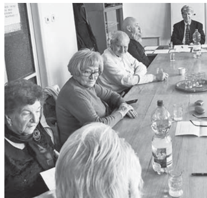
Na schôdzi v Košiciach.