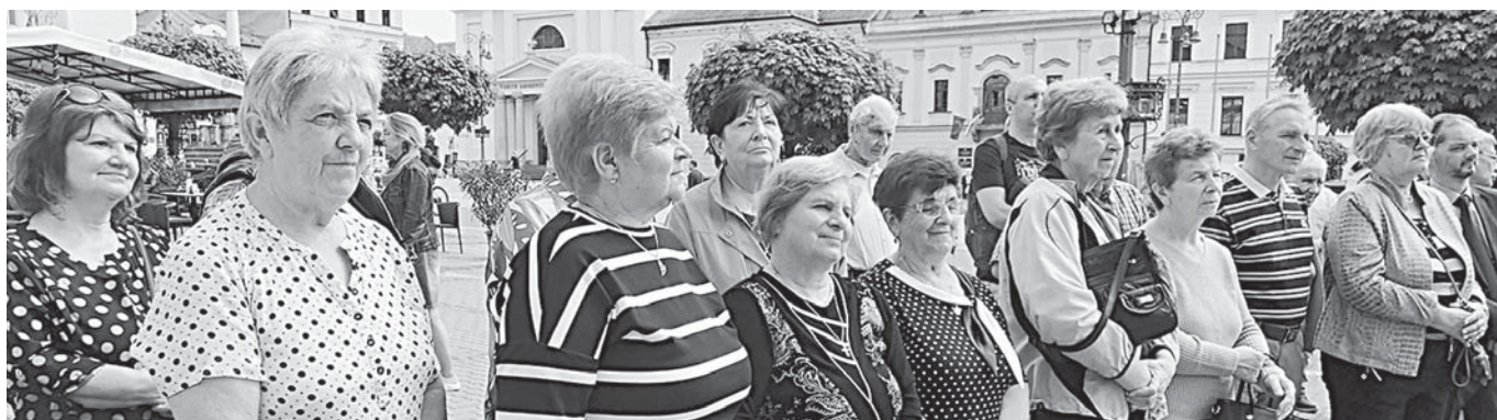
Slávnostná chvíľa počas pietneho aktu.