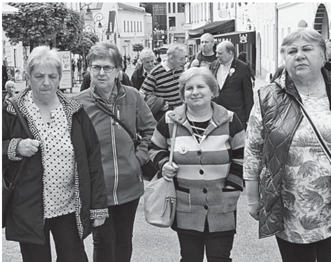
Na ceste z kostola k pamätnej tabuli.