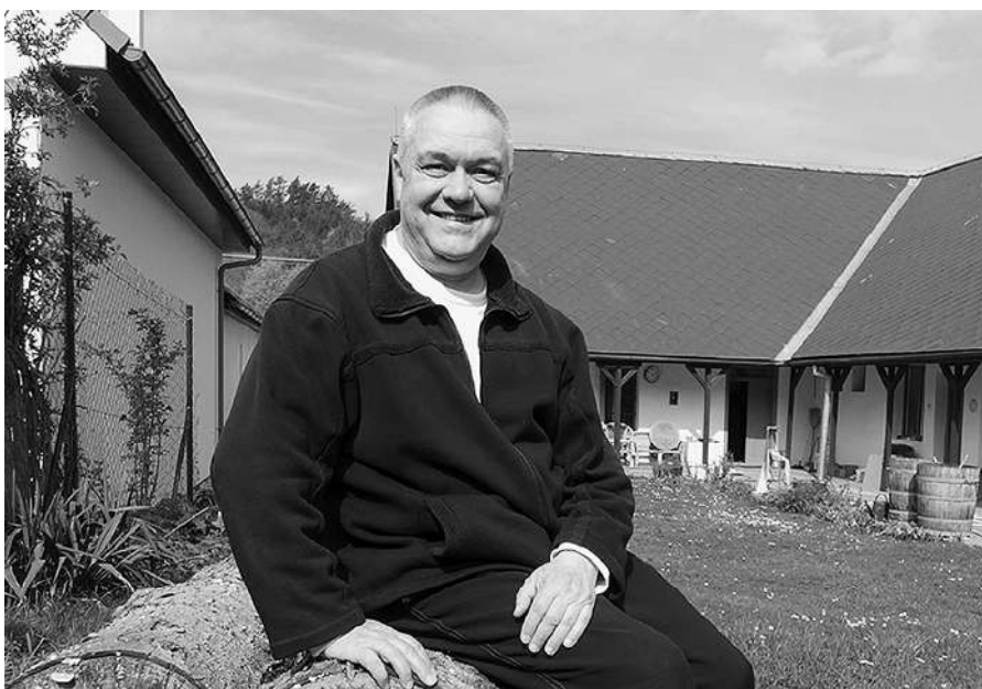
Posedenie na zvyšku smreka.