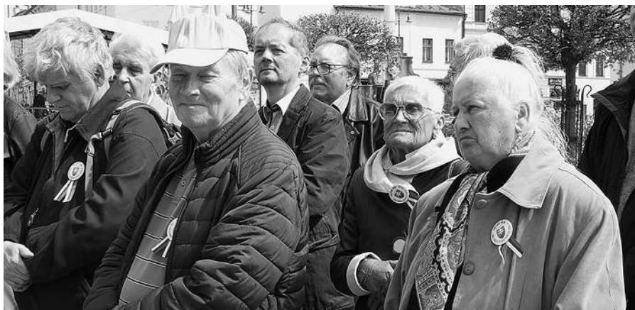
V Banskej Bystrici sa stretli členovia našej organizácie z celého Slovenska.