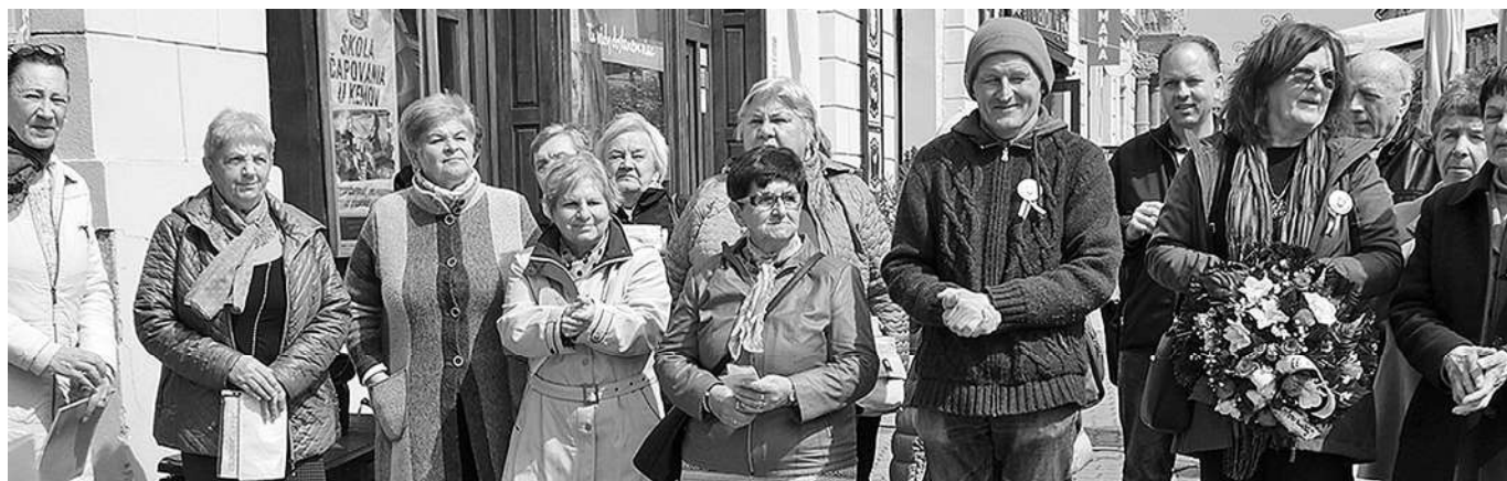
Speváčky z Heľpy prispievajú k slávnostnej atmosfére podujatia.