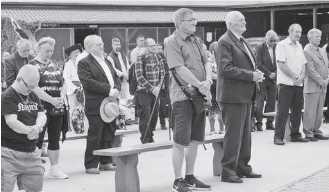
V Doľanoch počas sv. omše. ● A pred požehnaním sochy.