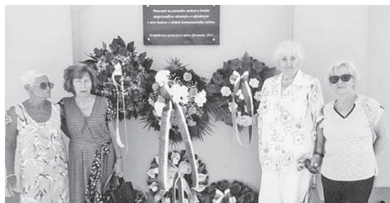
Členky PV ZPKO pri pamätnej tabuli.