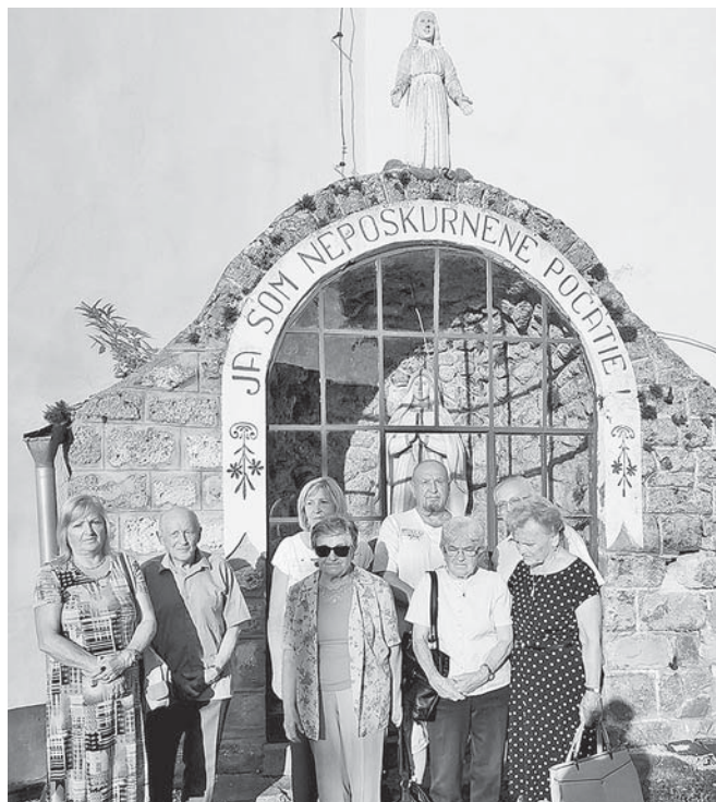
Účastníci pietnej spomienky v Zliechove.