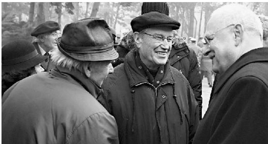
Po slávnostnom akte bol čas na rozhovory aj s prezidentom Gašparovičom. Na snímke so spisovateľom Antonom Hykischom.