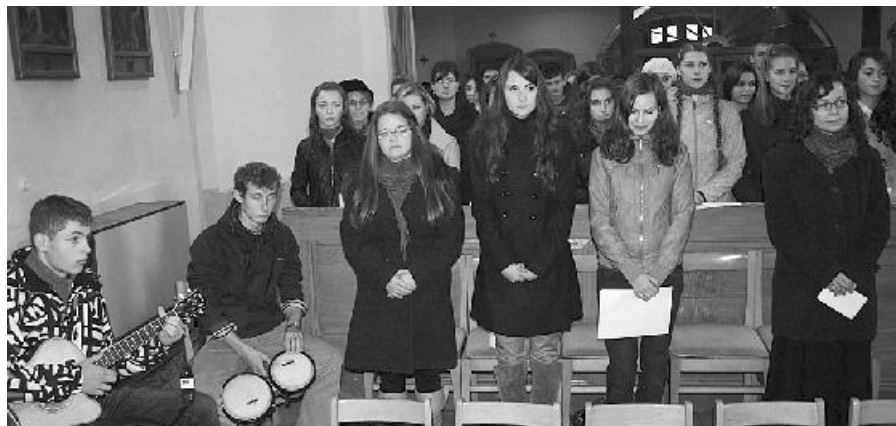
Študenti Gymnázia sv. Andreja v Ružomberku obohatili program pietnej spomienky.