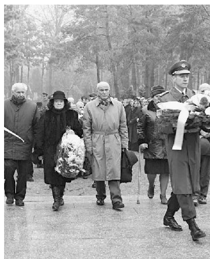
Slávnostný okamih pred pamätníkom.