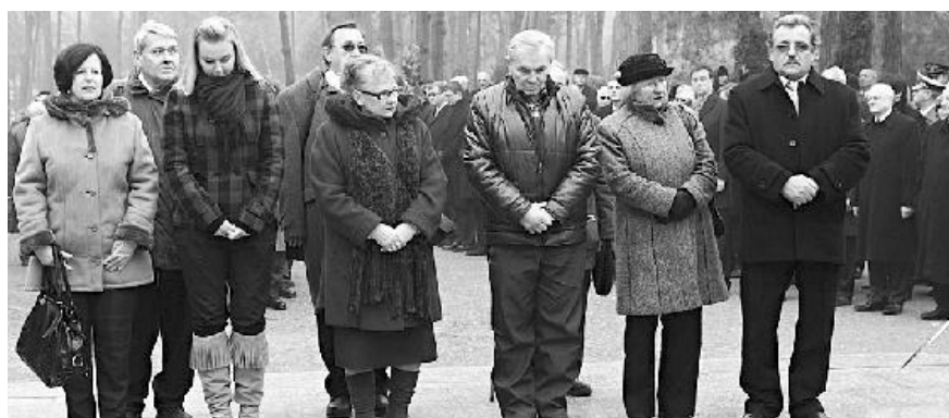
Členovia PV ZPKO sa po skupinách poklonili pamiatke obetí komunizmu na Ružinovskom cintoríne.