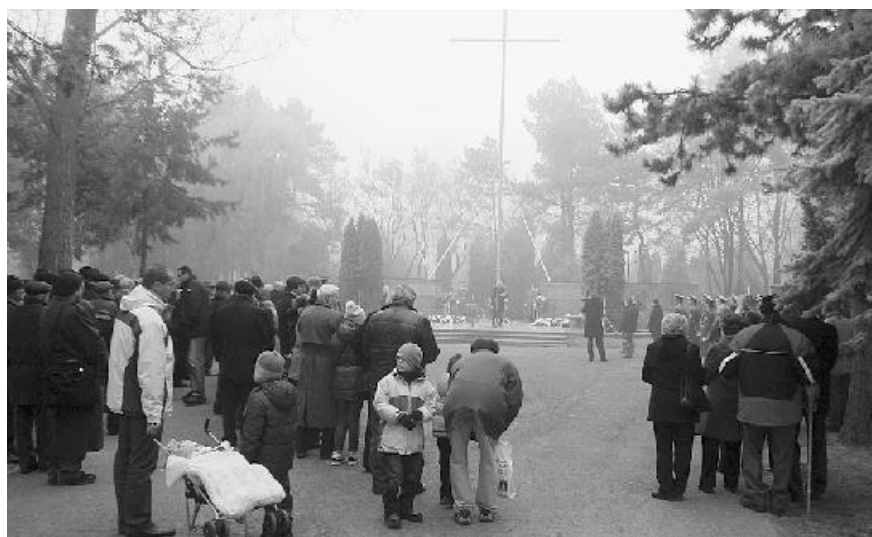
Sedemnásteho novembra sa na Ružinovskom cintoríne stretli všetky generácie.