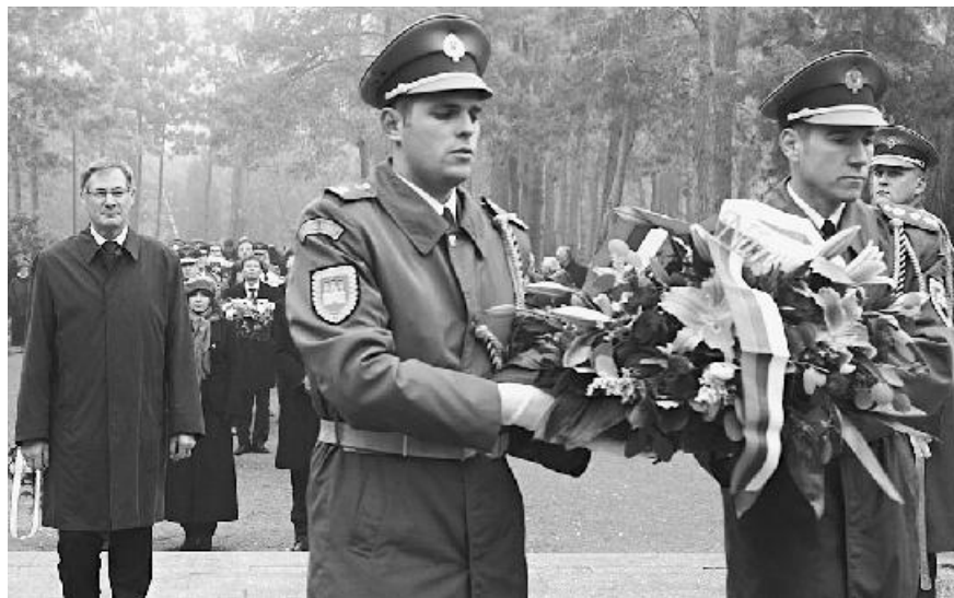
Predsa NR SR Pavol Hrušovský si našiel čas uctiť si pamiatku obetí komunizmu napriek tomu, že 17. novembra mal povinnosti v parlamente. Konal sa deň otvorených dverí NR SR.