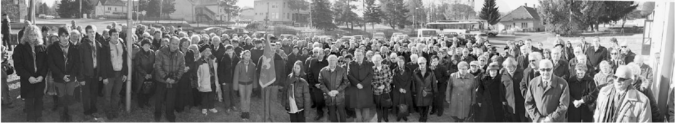
Rodiny politických väzňov z celého Slovenska sa zišli na pietnej spomienke pri pamätníku Rudolfa Juríka.