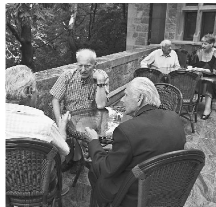
V Smoleniciach medzi kamarátmi.