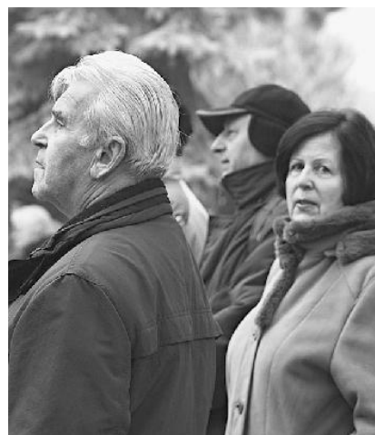
Bolo nad čím premýšľať...