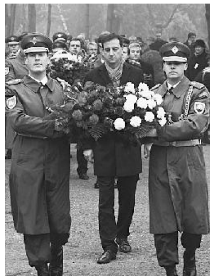
Na Ružinovský cintorín prišiel aj minister kultúry SR Daniel Krajcer.