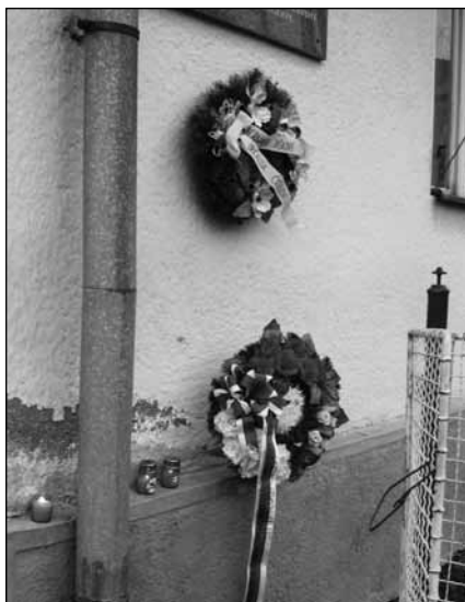
Živí nezabudli na hrdinstvo Jašku.