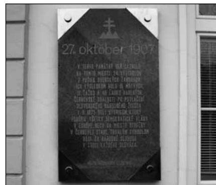
Pamätná tabuľa pripomínajúca udalosti z 27.10.1907, keď uhorskí žandári počas vysviacky kostola zastrelili 15 ľudí, 12 ťažko a 40 ľahko zranili. Pamätník v Černej je symbolom Slovákov za národnú slobodu.