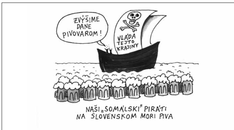
Kresba: Andrej Mišanek, prevzaté z Extra plus

Nuž veru tak, rozliční krtkovia, okrem tých užitočných, nám podryvajú a rozryvajú všetko, čo nás stáročia ochraňovalo. Lásku k vlasti, lásku k svojej, lásku ku kultúre a kresťanskej histórii. Aj v tom je demokracia...?